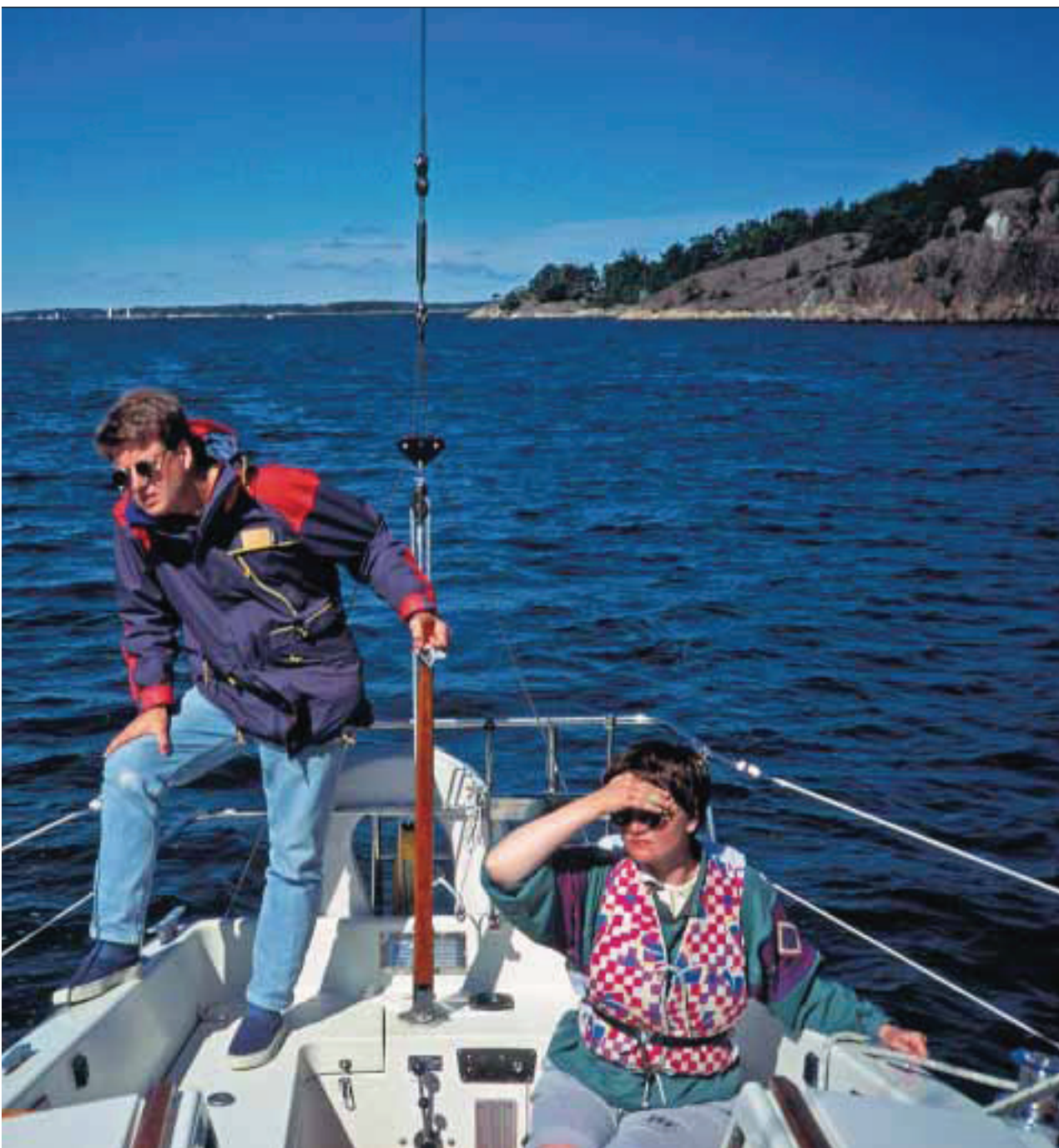
fredelig augeblikk i skjærgården.